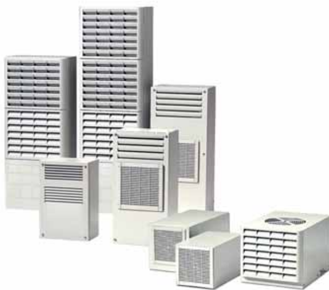
Rys. 1. Urządzenia klimatyzacyjne poprawiają jakość i zwiększają trwałość urządzeń instalowanych w szafach

Chłodziarki posiadają szeroki zakres mocy dopasowany do różnych potrzeb i założeń dla szaf sterowniczych.